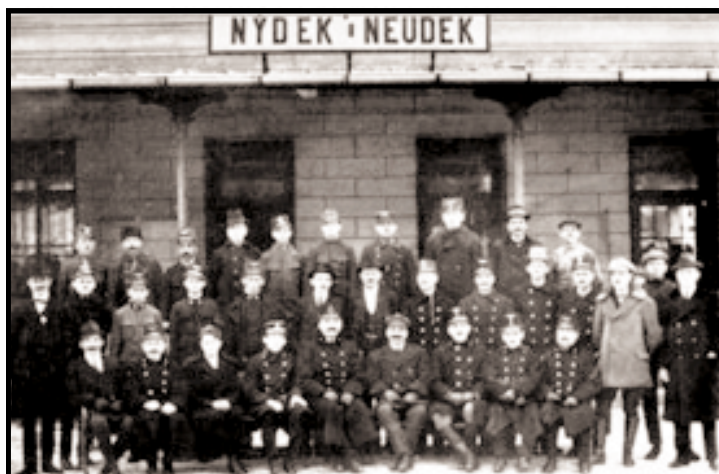
Část osazenstva nejdecké stanice v roce 1922

Vážení Nejdečané, v tento den, dají-li mocnosti, jako je Česká pošta a jiné, dostane každá nejdecká rodina, dům nebo byt do své schránky první číslo Nejdeckých radničních listů. Vydává je Vaše radnice a vydává je pro Vás. To proto, aby se Vám v našem městě lépe žilo a lépe s úřady ve styk přicházelo. To je to první a nejdůležitější, co byste o nich měli vědět. Do vínku si daly, že se nikdy nestanou tribunem názorů občanů nebo politických tahanic. Mají totiž jiný cíl. Posloužit Vám. Posloužit jako první, možná chabý, ale přece důkaz, že se cosi děje, mění. Že radnice, úřad nebo výbor ( pro některé ještě ) není parazit na těle města, ale užitečná instituce, která je tu pro Vás. Postupně Vám představíme jednotlivá oddělení a odbory a jejich pracovníky. A když už už budete vědět, s kým máte tu čest, pak Vám k ruce dáme seznam toho, co potřebujete k vyřízení Vaší věci třeba na matrice, stavebním úřadě, sociálce a tak dále. Měsíc co měsíc budete mít čerstvou informaci o stavebních akcích, uzavírkách, odstávkách a vůbec všech plánech města. Dozvíte se například o WITTE a nových fotbalových hřištích a o plánu na sportovní areál Limnice, o stěhování a zeštíhlování úřadu, o proměně městské polikliniky, o infocentru s internetem pro lid, o integrovaném záchranném systému a hasičské budoucnosti, o... Ale to už si přeci, věřím, že rádi, přečtete. Takže příště a DOBŘÍ NOVÝ DEN s Nejdeckými radničními listy Vám přeje Mgr. Luděk Sequens, starosta města.