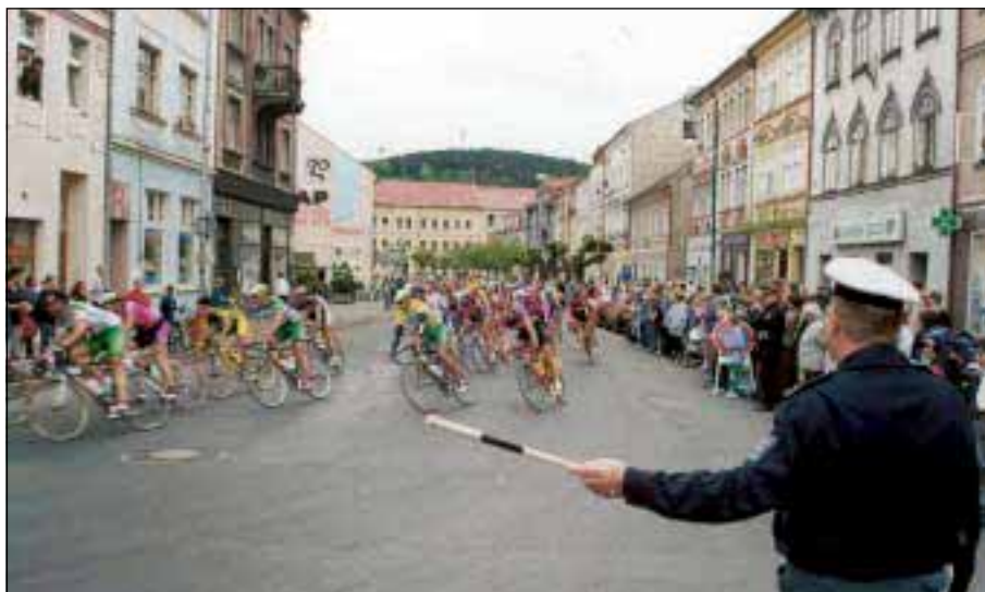
Policista ČR ukazuje účastníkům letošního Závodu míru i přihlížejícím divákům kudy!