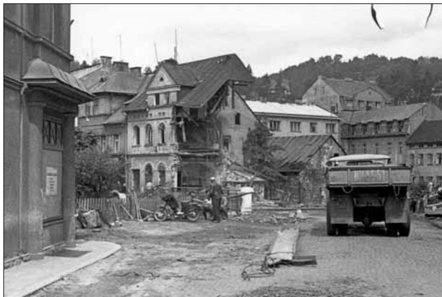
Mnoho domů muselo být po velké povodni v roce 1961 srovnáno se zemí. Tomuto osudu neunikni ani dům na Karlovarské ulici. Další fotografie a dokumenty můžete shlédnout na výstavě v galerii Zelená sedma od 15.6.2001.

O nejhrošším se však tehdy mlčelo. Ve Vysoké peci byla totiž v „jáchymovské éře“ (v roce 1953) vybudována z bývalé papírné chemická úpravná uranových rud. Ty se sem vozily z okolí (Jáchymov, Potůčky, Horní Slavkov), byly drceny, louženy kyselinami, v kalolisech filtrovány a výsledný koncentrát se v malých osmdesátikilových bečkách odvážel s vojenským doprovodem a v zapečetěných va-