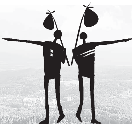
Neyd a Paynd

Naši budoucnost si tady na pětiku nevymslíme. Musíme se dobře a odborně připra-