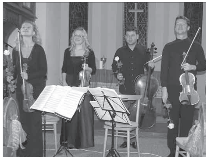
Pavel Haas Quartet v Nejdku

Název kvarteta si mladí umělci zvolili z úcty ke skladateli Pavlu Haasovi (bratr slavného herce Hugo Haase), který zahynul v koncentračním táboře v Terezíně. Strhující výkon česko-slovenského kvarteta (1. houslistka a violoncellista jsou Slováci) v beethovenovském večeru vyprovokoval návštěvníky ke skandovanému potlesku. Mladé kvarteto, které už koncertovalo mj. v newyorské Carnegie Hall nebo v salzburském Mozarteu, připravilo nejdeckým přátelům krásné hudby neopakovatelný zážitek. Vynikající akustika v chrámu Vykupitele, nejlepší možná pro hudbu klasicismu, dala aspoň na chvíli zapomenout na nedostatek vhodných a důstojných sálů pro vážnou hudbu v Nejdku.