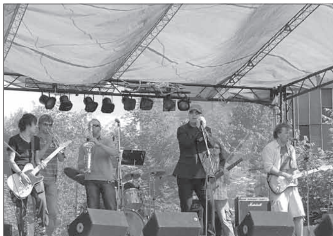
Rockové odpoledne u hasičárny zahájila skupina Pestalozzi