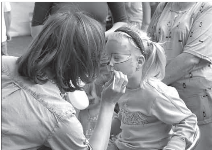
V dětském koutku si mohly děti vyrobit balónek 100x jinak nebo se nechat namalovat např. na malé tygry