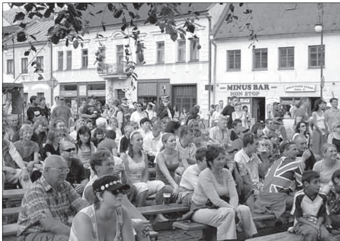
Publikum se celý den dobře bavilo