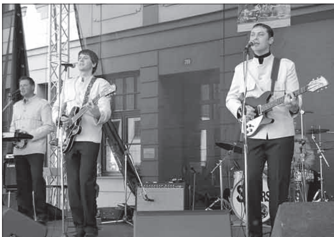
Písne od legendární skupiny The Beatles dostaly do varu celé náměstí