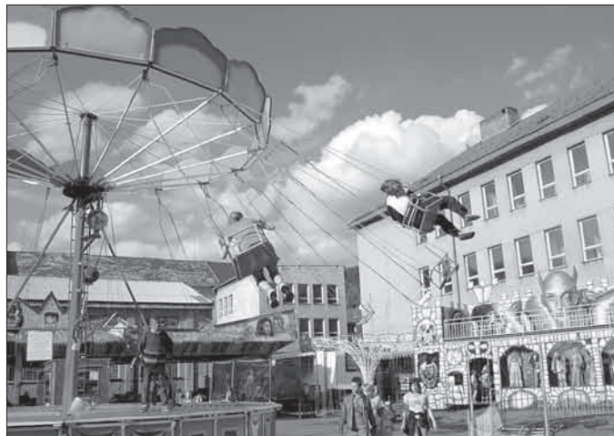
Atmosféru poutě dotvářely kolotoče