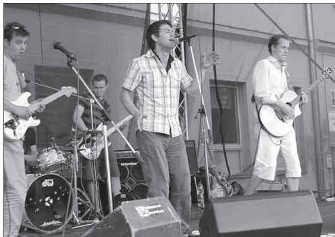
Česko-albánská skupina Htfakers dodala návštěvníkům poutě energii do slunečného odpoledne