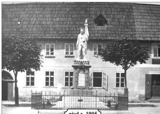
před r. 1905