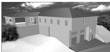
Vizualizace objektu. Pohled z Jateční ulice.

„V budově, která bude mít dvě patra, budou garážová stání pro dva sanitní vozy, pohotovostní ordinace zdravotnické záchranné služby s čekárnou, záložní zdroj elektrické energie, potřebné komunikační, výpočetní a spojové zařízení