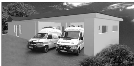
Vizualizace objektu. Pohled z Karlovarské ulice.

V počátečním období činnosti nového výjezdového střediska bude v Nejdku dislokována posádka RZP (rychlé zdravotnické pomoci), tedy posádka se sestrou. Zdravotníci se budou střídát zpočátku ve směnném provozu nepřetržitě po 24 hodin. Jakmile bude