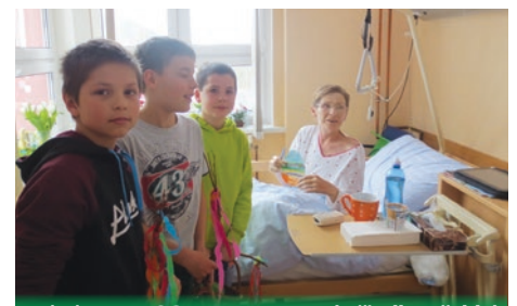
Koleda v REHOSU