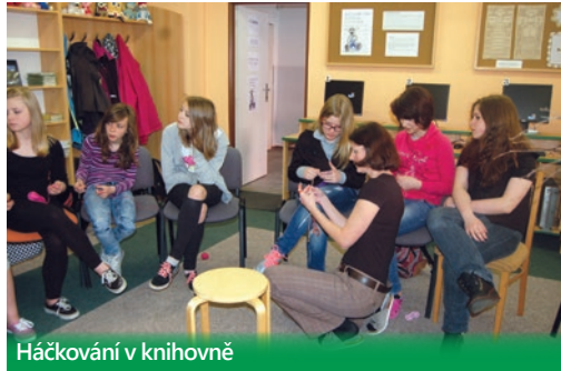
Háčkování v knihovně