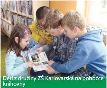
Děti z družiny ZŠ Karlovarská na pobočce knihovny