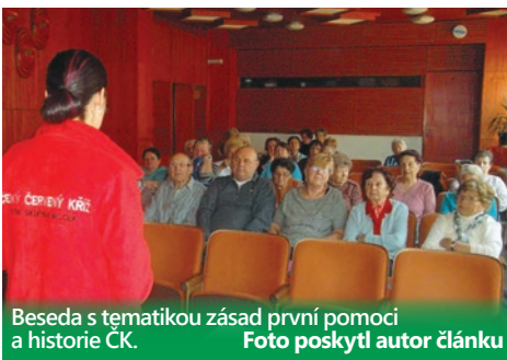
Beseda s tematikou zásad první pomoci a historie ČK.

12. 5. - zájezd do divadla v K. Varech na představení opery Oskara Nedbala „Polská krev“ v podání souboru plzeňského Divadla J.K.Tyla.