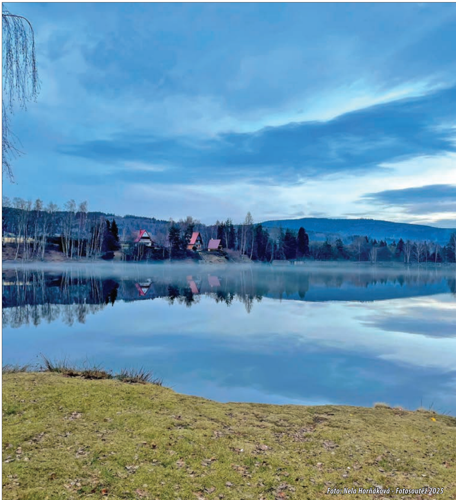
Fotosoutěž 2025