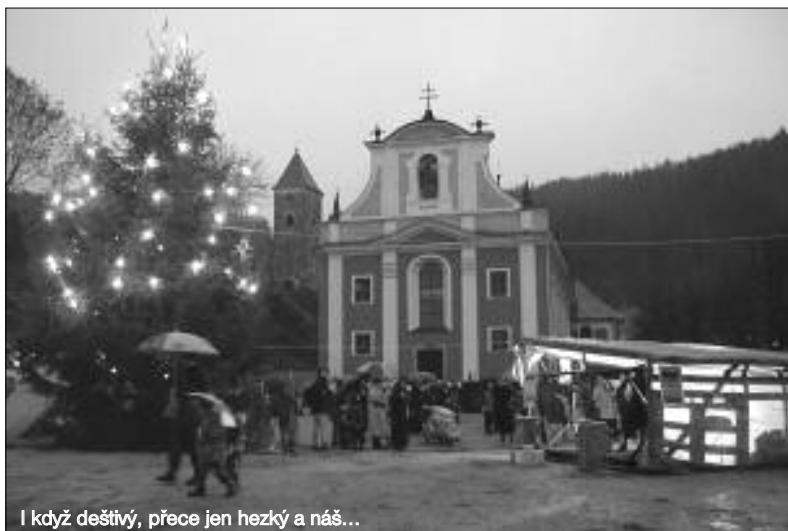
I když deštivý, přece jen hezký a náš...

20. století. I když jsou některé kapitoly dotazeny až do roku 1923, většina jich končí právě rokem 1914. Například vznik Československa v roce 1918 se zde objevuje jen velmi okrajově. Ani Pilzovi se zřejmě příliš nechtělo do popisu událostí, které zásadně změnily podobu Evropy, a to ještě neměl tušení o nějaké světové válce s pořadovým číslem dvě. Dějiny dvacátého století není odkud přeložit, musíme je napsat sami. Věřím, že se najde někdo, kdo se nebude bát psát o městě, kde třeba i uspořádání výstavy Zmizelé Sudety či překlad německé kroniky jsou některými spoluobčany mylně vnímány jako nedostatek vlastenectví.