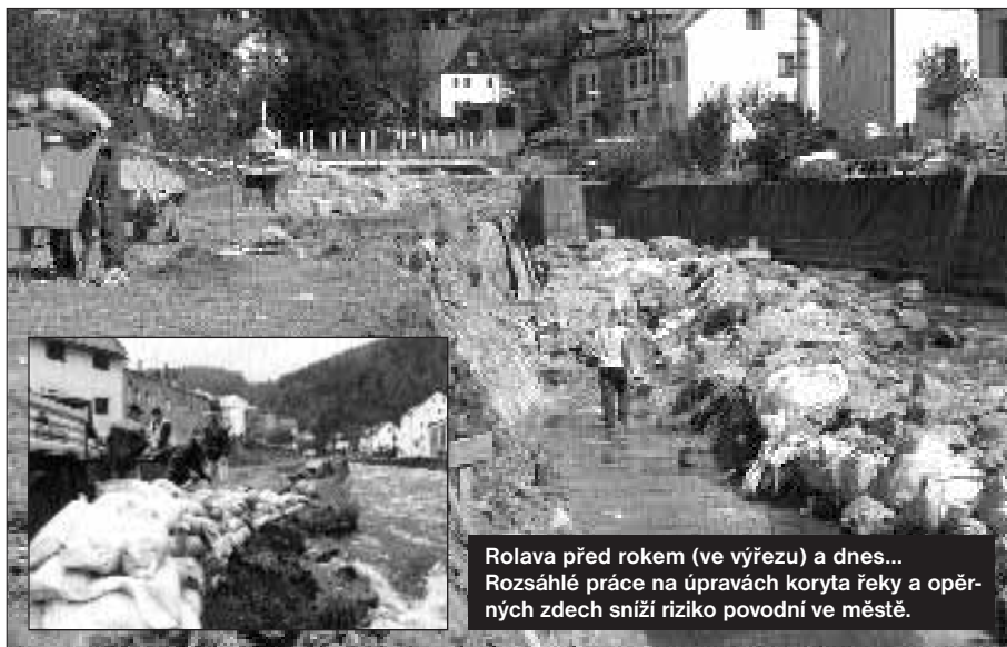
Rolava před rokem (ve výřezu) a dnes... Rozsáhlé práce na úpravách koryta řeky a operních zdech sníží riziko povodní ve městě.

V tomto čísle najdete mimořádnou přílohu ÚZEMNÍ PLÁN MĚSTA NEJDEK