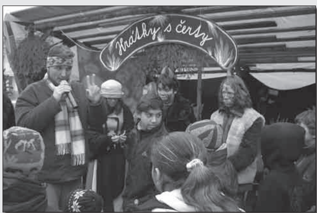
Nejmenší návštěvníky nově přilákalo vánoční soutěžení s překvapením u stánku s čertem a Káčou, který byl dílem ZŠ Karlovarská.