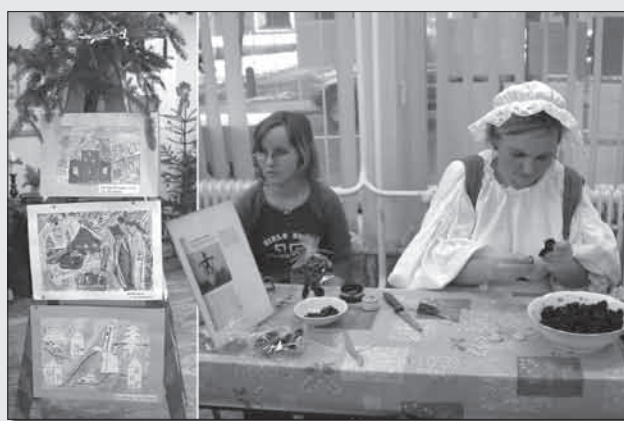
V teplém a útulném prostředí přízemí knihovny, za poslechu koled, vyráběly děti staročeské čertíky ze sušených švestek a svícny z přírodnin. Zároveň zde návštěvníci mohli zhlédnout výstavu dětských prací s názvem „Ladova zima“.