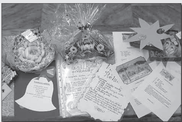
Soutěž Nejdecký vanilkový rohlíček v kategorii „cukroví“ a „recept“ připravila ZŠ náměstí. Z pěti soutěžících byli vyhodnoceni tři v každé kategorii. Recepty zpracované v knižní podobě můžete zhlédnout v infocentru.