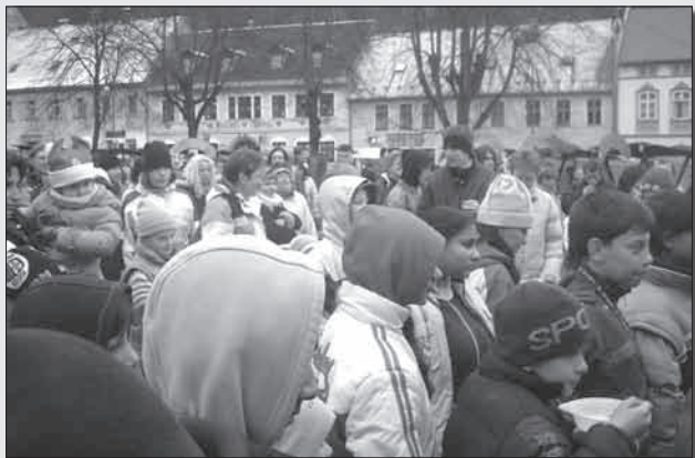
I přes nepřízeň počasí neměl IX. Krušnohorský jarmark o své návštěvníky nouzi.