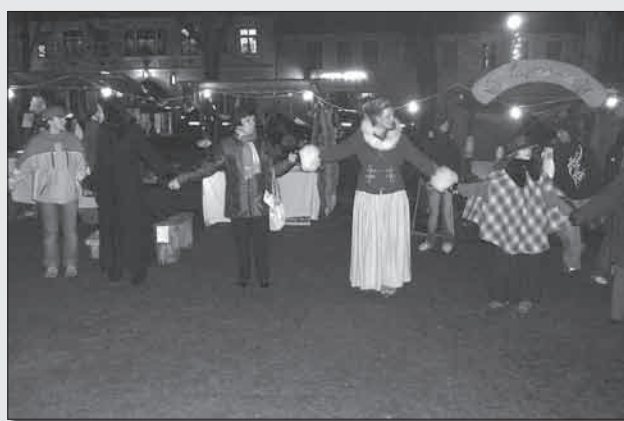
Při Krušnohorském řetězu vánočního přátelství se spojily „malé a velké ruce“ a utvořily živý řetěz, který změřili místní hasiči. Měřil úctyhodných 146,6 metrů.