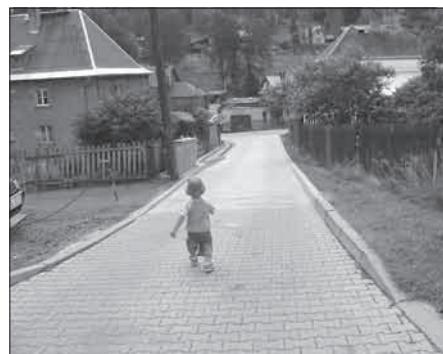
...a po celkové rekonstrukci.