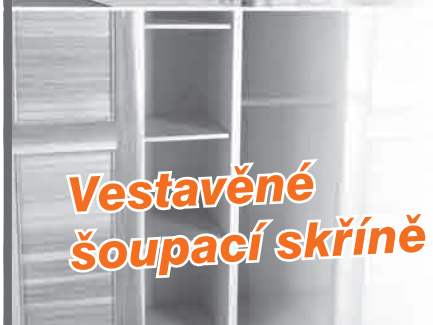
Vestavěné šoupací skříně