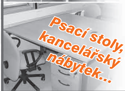
Psací stoly, kancelářský nábytek...