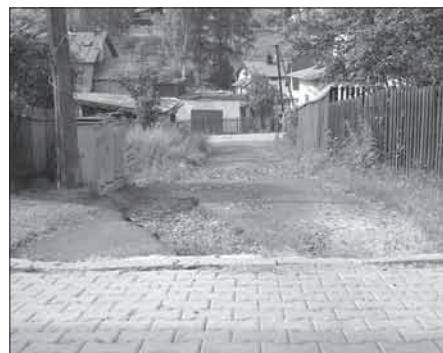
Ulička spojující komunikaci B. Němcové a Jungmannovu před...