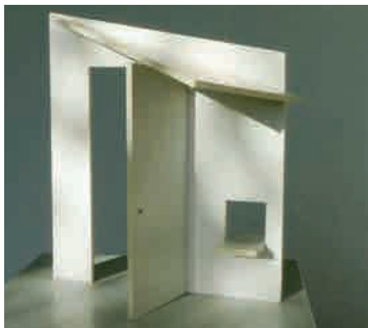
Návrh památníku s otevřenými dveřmi