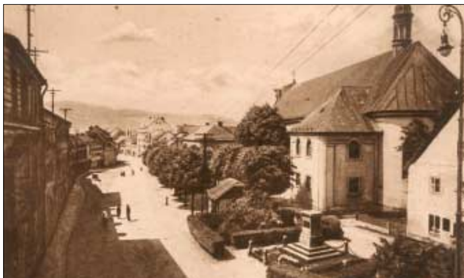
Pohled na horní část náměstí po roce 1919.