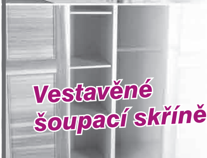
Vestavěné šoupací skříně