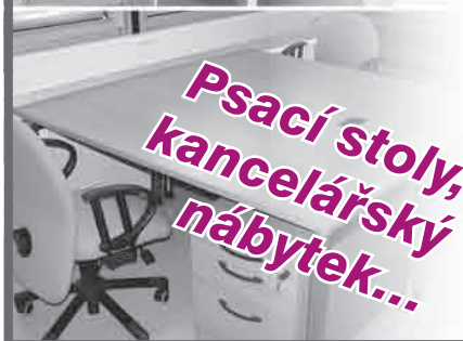
Psací stoly, kancelářský nábytek...