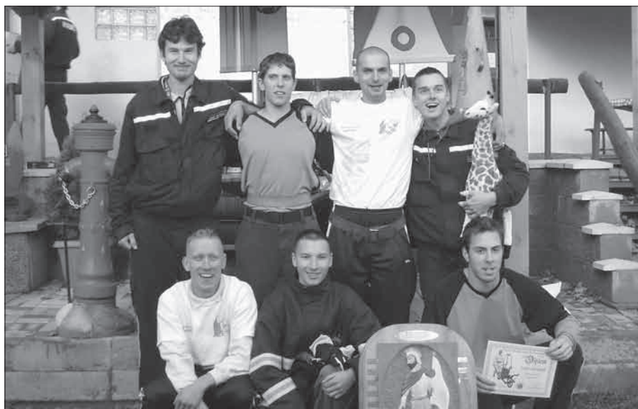
Vítězné družstvo MirNej